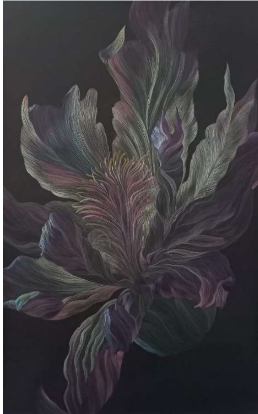
Lina Vila, Oscuridad floreciente , 2024

Lina Vila | Oscuridad floreciente 4 de diciembre, 2024 – 2 de febrero, 2025 Inauguración: 4 de diciembre, a las 20 h