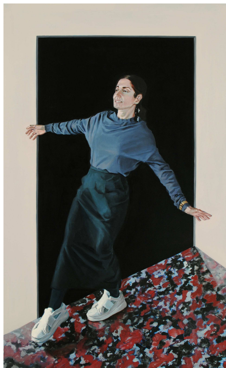
Javier Aquilué, La casa magnética , 2020

El Ojo Vago. Aspectos productivos de lo disfuncional en el arte contemporáneo