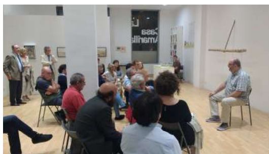
Ante la imagen. 26 septiembre 2017