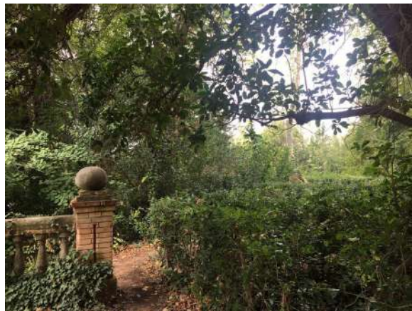
Paseo. Jardín Estación Experimental Aula Dei. 23 septiembre 2017