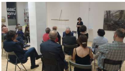
Ante la imagen. 26 septiembre 2017