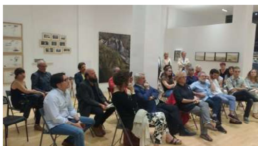
Ante la imagen. 26 septiembre 2017