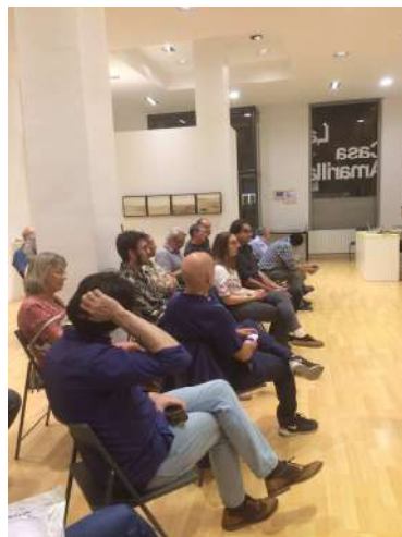
Ante la imagen. 3 octubre 2017