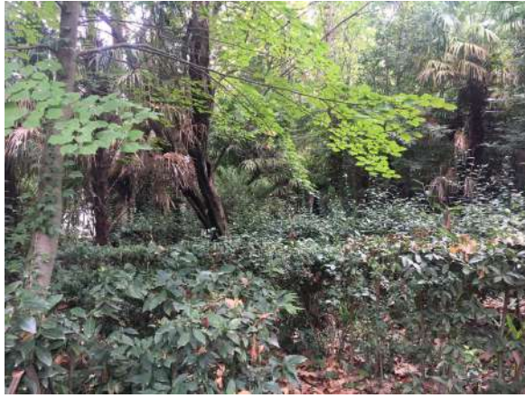
Paseo. Jardín Estación Experimental Aula Dei. 23 septiembre 2017