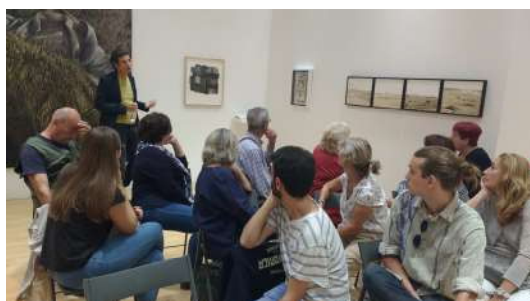
Ante la imagen. 26 de septiembre 2017