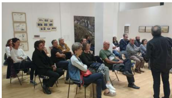
Ante la imagen, 19 septiembre 2017