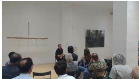
Ante la imagen. 3 octubre 2017