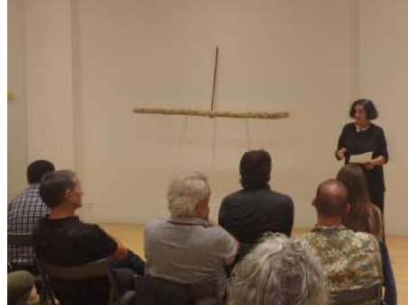
Ante la imagen. 3 octubre 2017