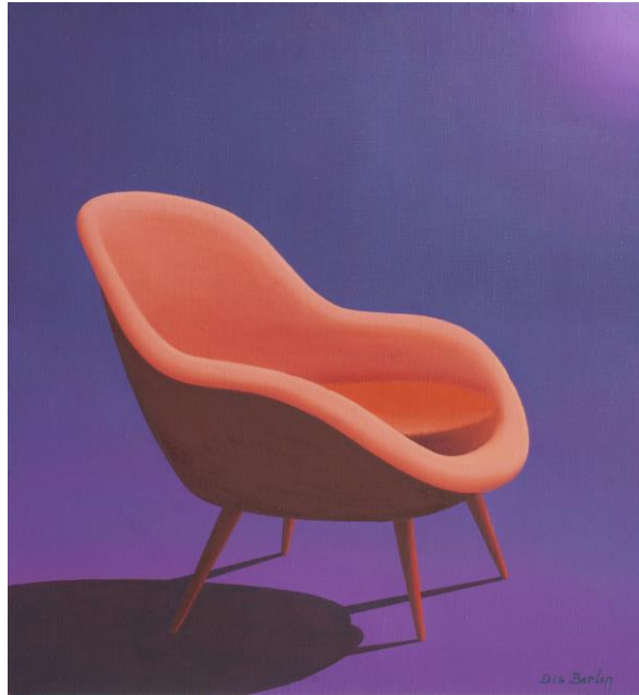
Dis Berlin, Noctámbulo solitario , 2020.

El primer sentimiento del hombre fue la soledad, consigna Massimo Cacciari: nacemos heridos de soledad. Sin embargo, como el filósofo ha encontrado en los textos de Leopardi, Celan, Petrarca, Musil o Beckett, estar solo invita a activar la memoria, a no olvidar. El solitario es incapaz de olvidar; sólo es posible rastrear las huellas de la ausencia, y eso es lo que proponemos con las obras de artistas presentes en este proyecto. Su refugio lo encuentran en la soledad que nos brindan en imágenes esenciales, quietas y silentes, alejadas del ruido y de la multitud.