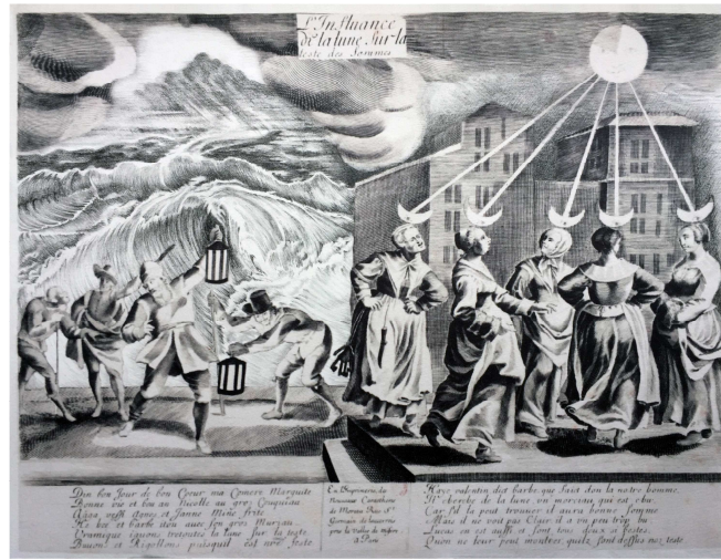
Sara Quintero. Cinco mujeres bajo la influencia , 2019 La Casa Amarilla

Exposición: 27 de abril _ 13 de julio, 2019