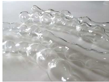
Sandra Moneny, Semillas , 2019