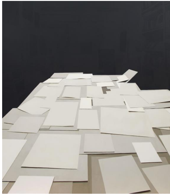
Fernando Martín Godoy, Estudio I , 2018. La Casa Amarilla

Inauguración: 11 de diciembre, a las 19:00 h