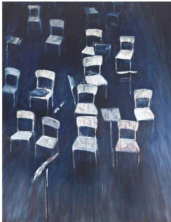
Louisa Holecz, Interval -for Jacqueline du Pré- , 2018.

Interval -for Jacqueline du Pré- (Intervalo -Para Jacqueline du Pré-) , 2018. Óleo sobre lienzo. 195 x 150 cm